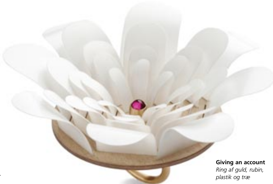
Giving an account Ring af guld, rubin, plastik og træ

– Jeg har valgt en placering tæt på hjertet – et privat sted – for at understrege, at det er bæreren, der har magten og bestemmer, hvem der får en billet, og hvem der ikke gør.